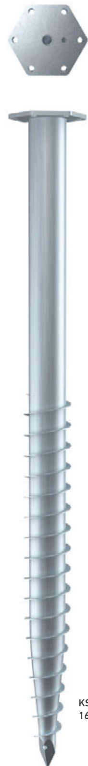
KSF M 89x 1600-M24